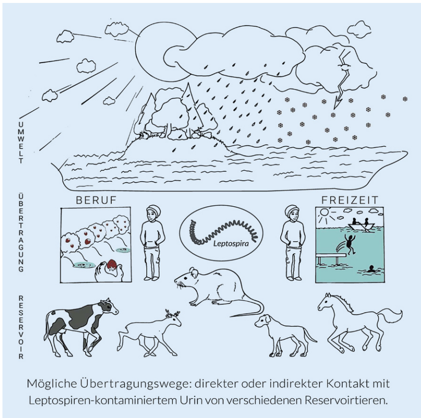
Abb. 1 ▲ Übertragungswege von Leptospiren. Die Ansteckung des Menschen mit Leptospiren erfolgt über Schleimhäute oder kleine Verletzungen. Dies geschieht entweder direkt durch Kontakt mit Urin, Blut oder Gewebe infizierter Tiere oder indirekt z. B. durch urinkontaminiertes Wasser. Wenn berufsbedingt Kontakt zu Reservoirtieren besteht oder das Freizeitverhalten zur Exposition führt (z. B. Wassersport), kann das Infektionsrisiko erhöht sein. Auch Wetterbedingungen (z. B. Niederschlag) können das Infektionsrisiko erhöhen, da warme und feuchte Umgebungsbedingungen das Überleben der Leptospiren in der Umwelt fördern